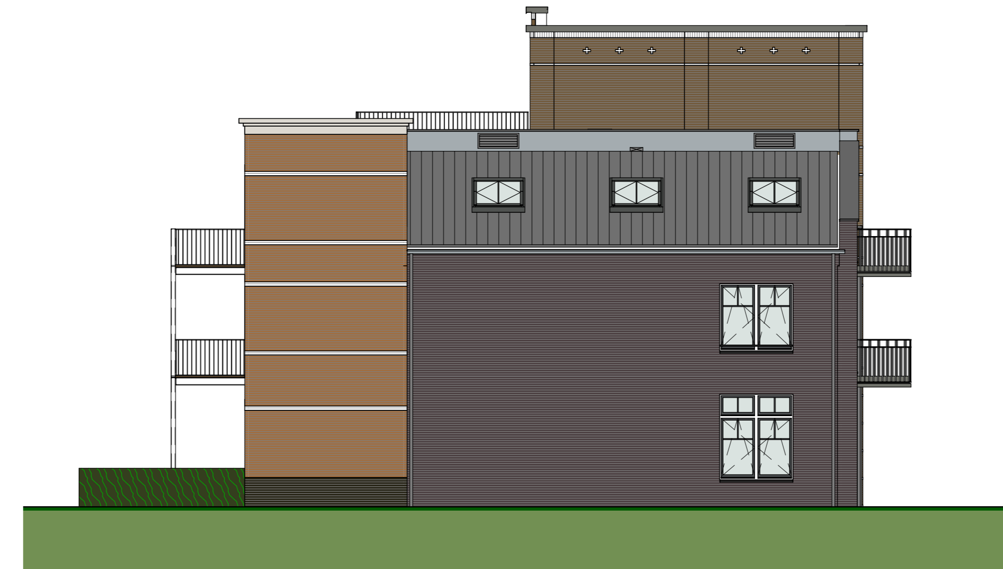
zijgevel, 't Marken