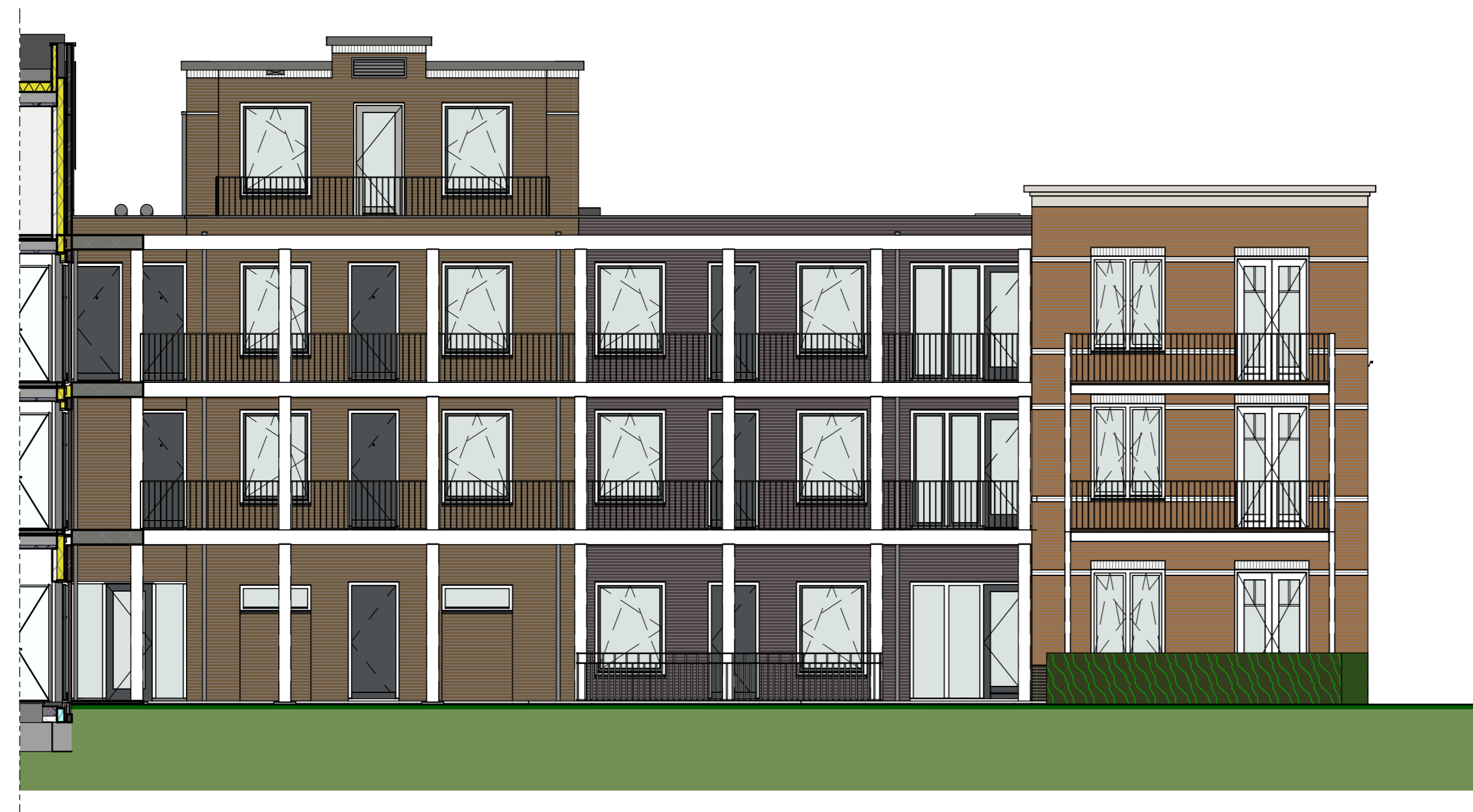
achtergevel, 't Marken