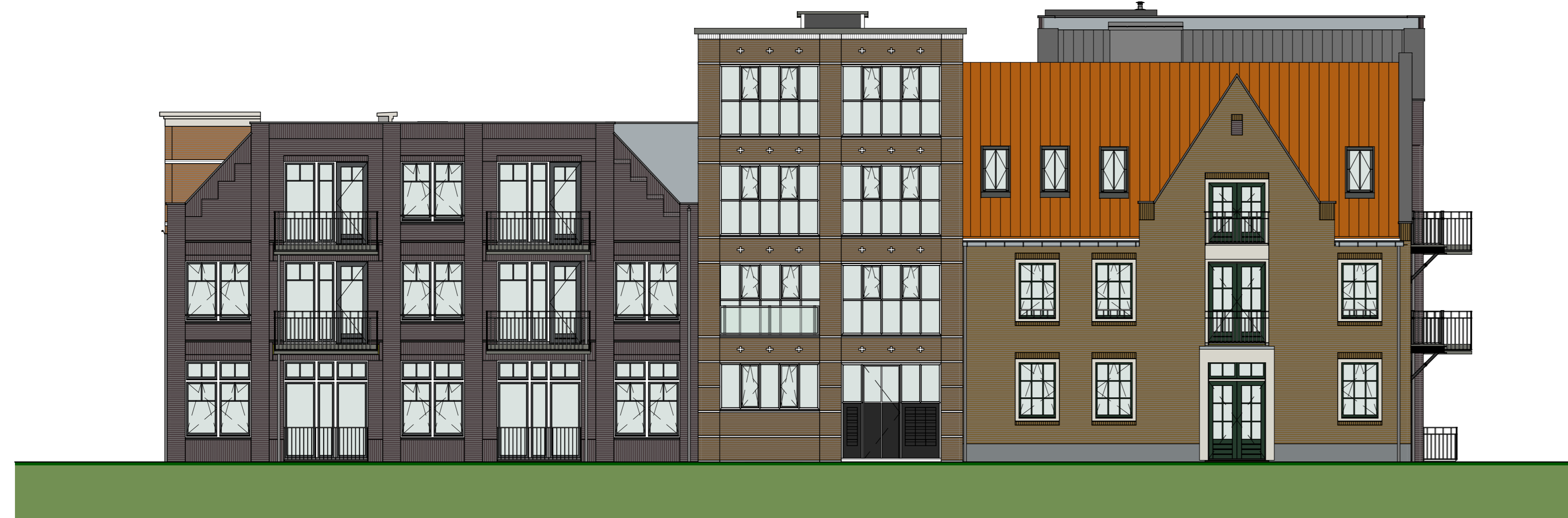
voorgevel, 't Marken